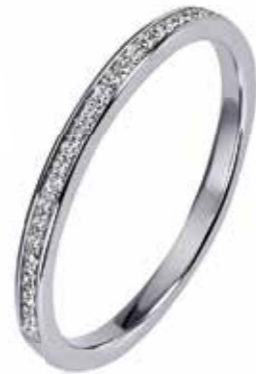
DAMENRING 585.- Weissgold 29 Diamanten 0,11 ct SI/1 W je € 483,-