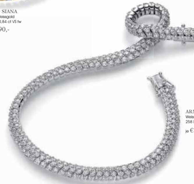
ARMBAND SHANNON Weissgold mit Palladium 258 Diamanten 4,38 ct VS fw je € 16290,-