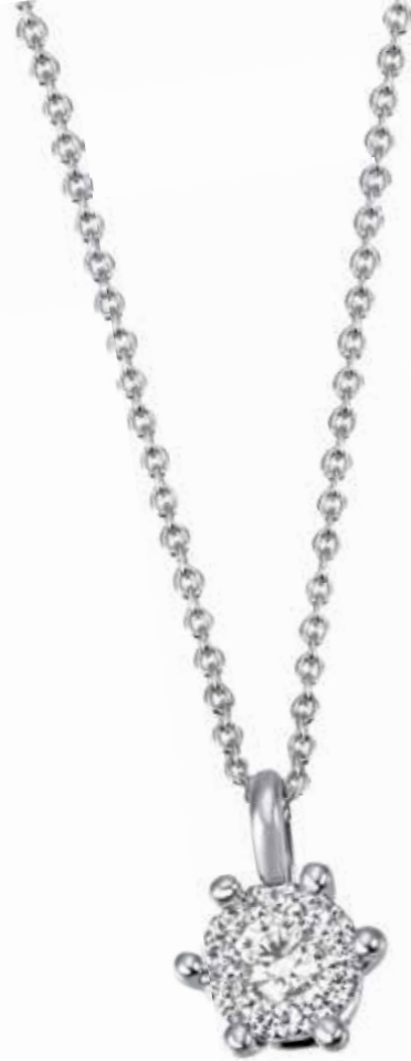
COLLIER 585.- Weissgold 10 Diamanten 0,14 ct SI/1 W je € 793,-