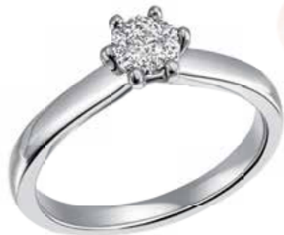
DAMENRING 585.- Weissgold 10 Diamanten 0,08 ct SI/1 W je € 713,-