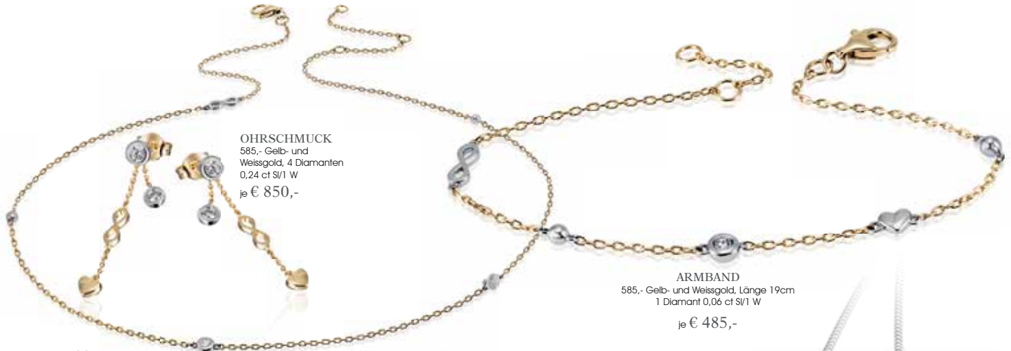
OHRSCHMUCK 585,- Gelb- und Weissgold, 4 Diamanten 0,24 ct SI/1 W je € 850,-