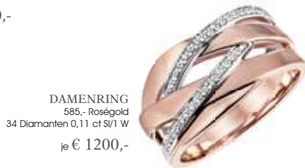
DAMENRING 585,- Roségold 34 Diamanten 0,11 ct SI/1 W je € 1200,-