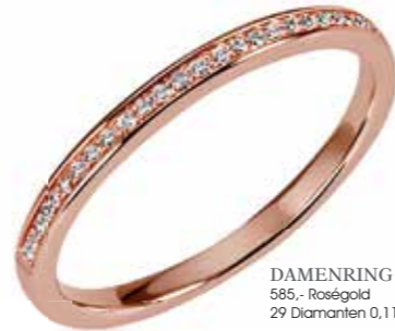
DAMENRING 585.- Roségold 29 Diamanten 0,11 ct SI/1 W je € 490,-