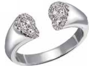
DAMENRING 585,- Weissgold 42 Diamanten 0,50 ct SI/1 W je € 2140,-