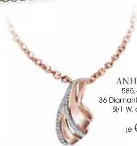
ANHÄNGER 585,- Roségold 36 Diamanten 0,12 ct SI/1 W, ohne Kette je € 630,-