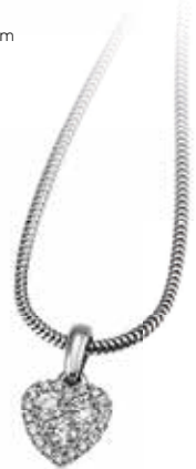
ANHÄNGER 585,- Weissgold 21 Diamanten 0,25 ct SI/1 W, ohne Kette je € 850,-