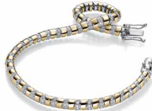
ARMBAND SIANA 18 kt Gelb/Weissgold 132 Diamanten 0,84 ct VS fw je € 6590,-