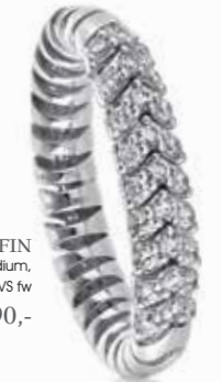
RING SERAFIN 18 kt Weissgold mit Palladium, 27 Diamanten 0,45 ct VS fw je € 2890,-