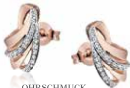
OHRSCHMUCK 585,- Roségold 46 Diamanten 0,16 ct SI/1 W je € 760,-