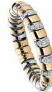
RING SIANA 18 kt Gelb/Weissgold 45 Diamanten 0,26 ct VS fw je € 2390,-